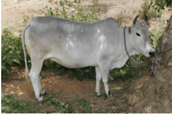
ಖೇರಿಗರ್ ಹಸು, ಉತ್ತರ ಪ್ರದೇಶ

ನಂಬಿ; ಈ ತಳಿಯೊಂದು ಅಚ್ಚರಿ. ಕಾರಣ ಇದರ ಆಹಾರ. ಇದರ ಆಹಾರಸೇವನೆಯ ಪ್ರಮಾಣಕ್ಕೂ ಇದರ ಕಾರ್ಯಸಾಮರ್ಥ್ಯಕ್ಕೂ ಒಂದಕ್ಕೊಂದು ಅರ್ಧಾತ್ ಸಂಬಂಧವಿಲ್ಲ. ಇಷ್ಟೇ ತಿಂದು ಅಷ್ಟು ಹೊತ್ತಿತೇ? ಅಷ್ಟು ನಡೆದಿತೇ? ಅಷ್ಟು ಊಳಬಲ್ಲದೇ? ಎಂದು ಮೂಗಿನವೇಲೆ ಬೆರಳಿಡುವ ಹಾಗಿದೆ ಖೇರಿಗರ್.